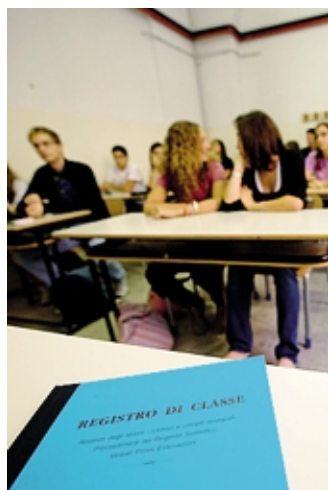
Quasi 900 le cattedre in scadenza

La denuncia arriva dalla Cisl scuola che per la nostra provincia ha stimato una carenza di docenti di sostegno pari a 21 per la scuola dell'infanzia, 415 per la primaria, 329 per la secondaria di primo grado e di 148 per quella di secondo grado. In totale dunque mancherebbero 913 docenti di sostegno, fatto salvo il numero di quelli che, dopo aver concluso il percorso formativo e ottenuto recentemente la specializ-